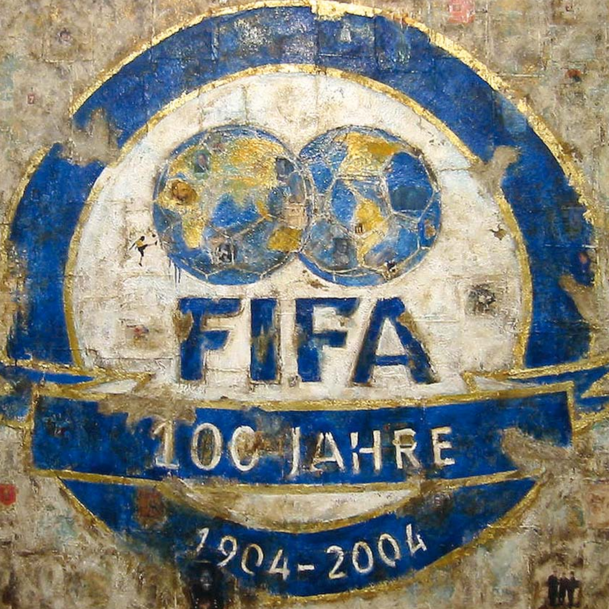
100-jähriges Jubiläum FIFA, Zentrale Zürich, Schweiz