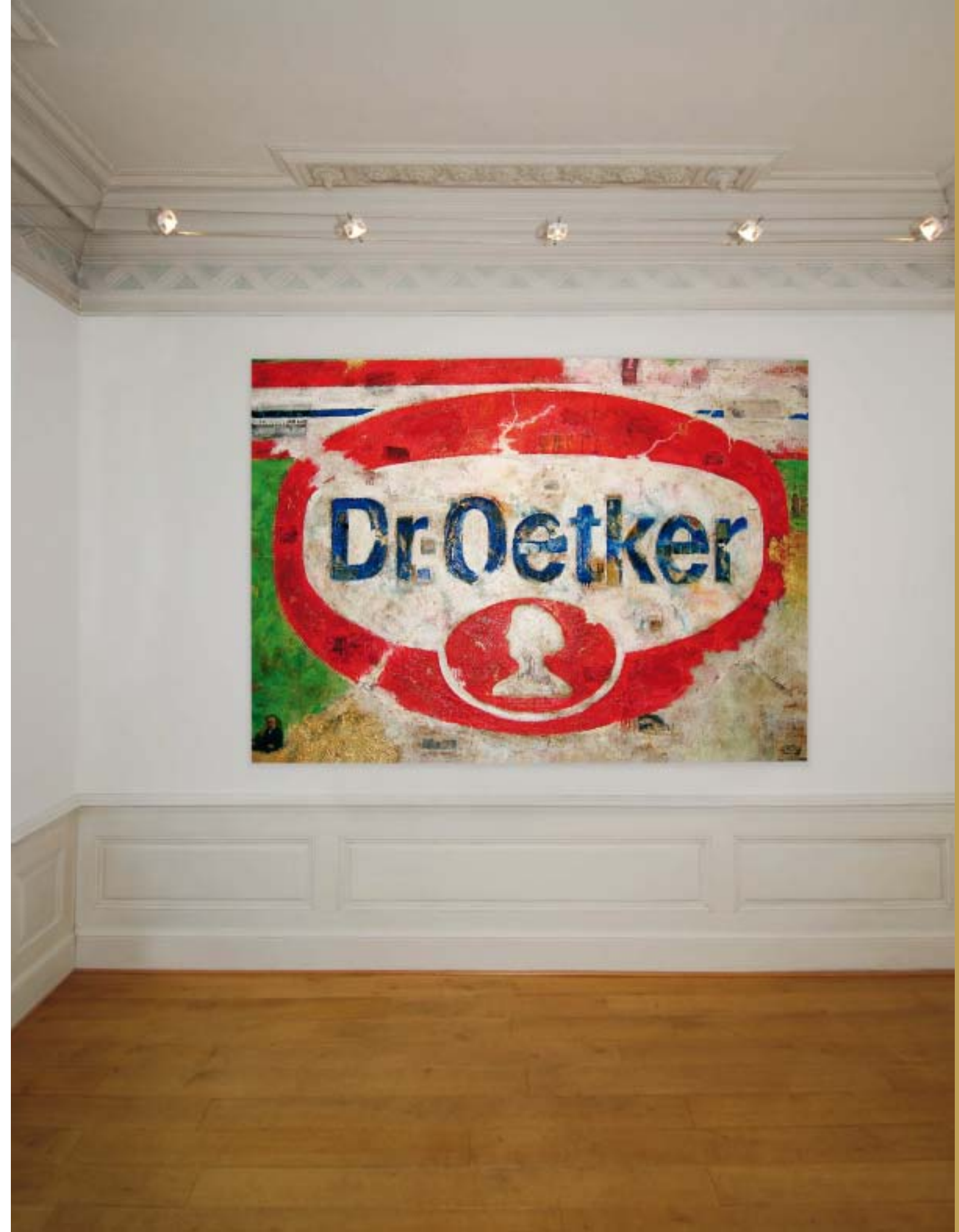
Dr. Oetker, 200 cm x 150 cm, Einweihung des Neubaus für die Oetker-Welt, Bielefeld