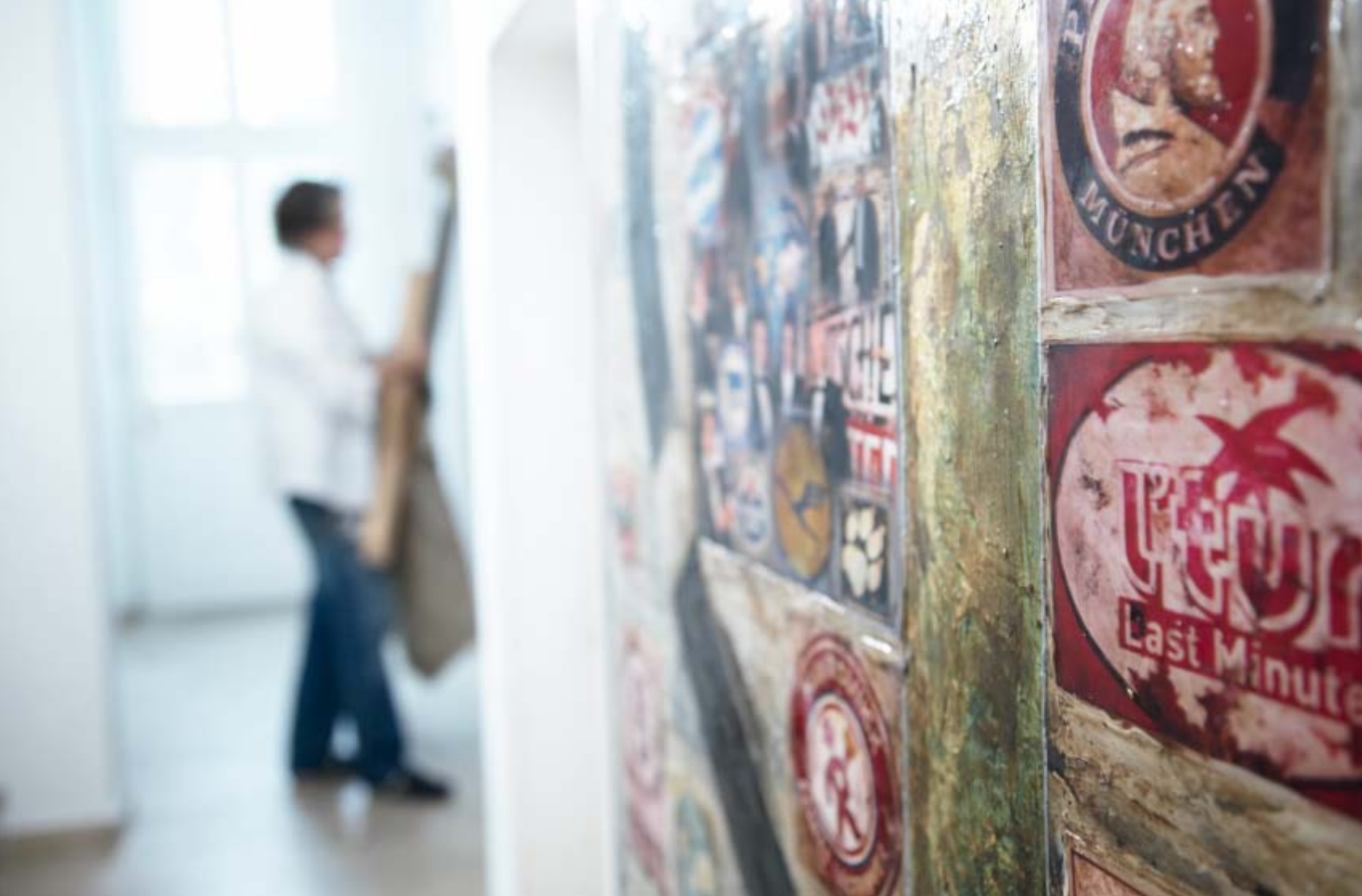
Impressionen aus dem Atelier