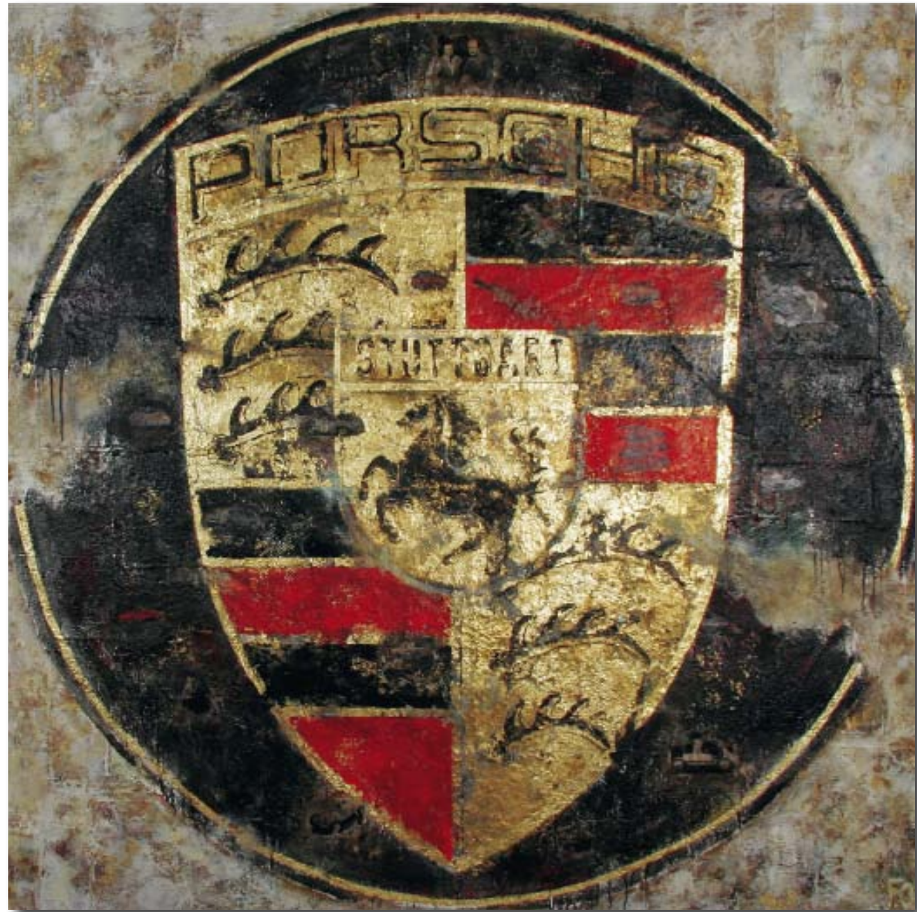
190 cm x 190 cm, Mischtechnik auf Leinwand