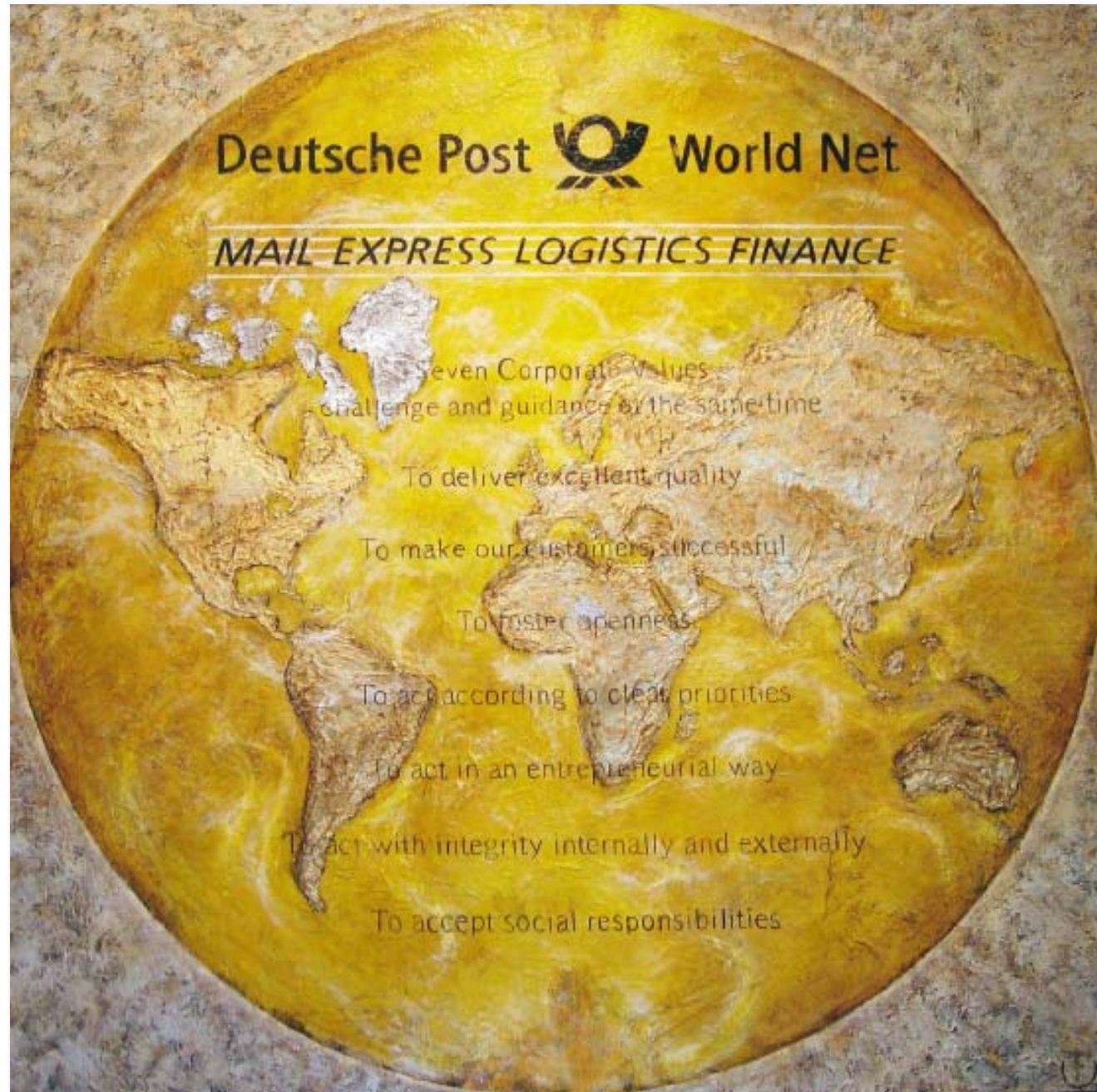
200 cm x 200 cm, Mischtechnik auf Leinwand

Künstlerische Interpretation von Marken durch den Einsatz von Weltkugeln