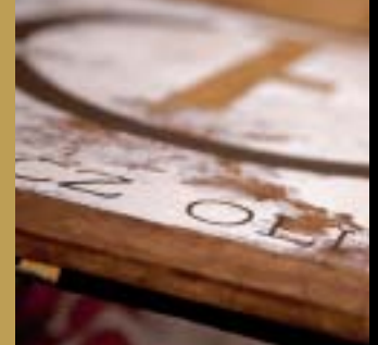
Künstlerische Interpretation des Logos „Ferencz Olivier“ auf einer Schatztruhe