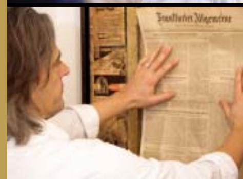
Ein ZeitArt-Kunstwerk berührt den Betrachter immer emotional