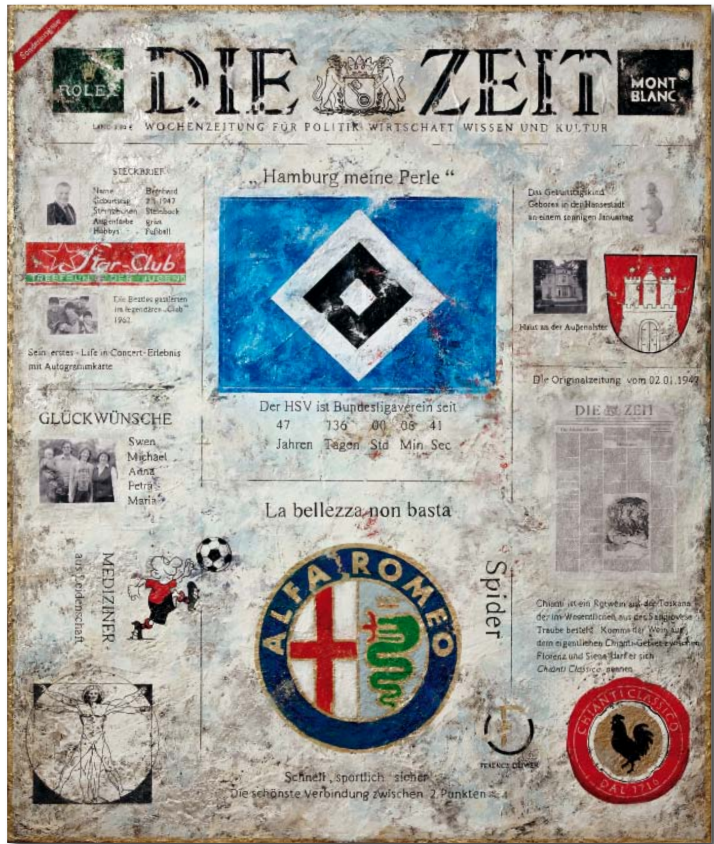
190 cm x 160 cm, Mischtechnik/Collage auf Leinwand

Beispiel für die Premium-Version: Hier wurden die wichtigsten Bildmarken wie Lieblingsverein, Automarke, Wappen des Geburtsortes sowie Hobbys gemalt und zusätzlich die Titelseite der Originalzeitung für den Jubilar einge- arbeitet