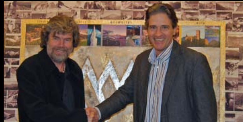
Bildübergabe an Reinhold Messner anlässlich seines 60. Geburtstages für das Messner Mountain Museum, Bozen