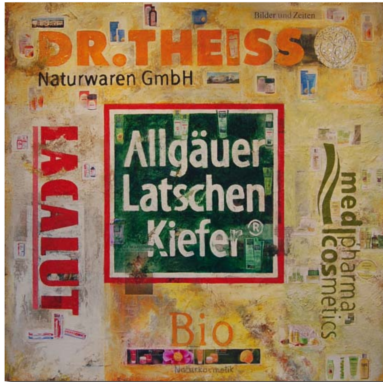
195 cm x 195 cm, Mischtechnik auf Leinwand