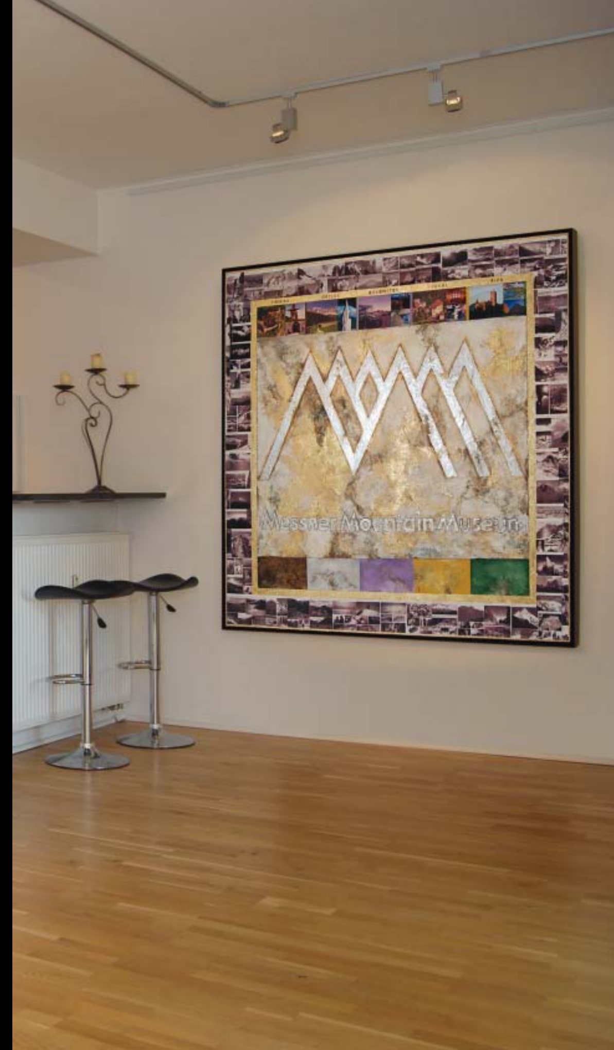
205 cm x 205 cm, Öl/Collage auf Leinwand