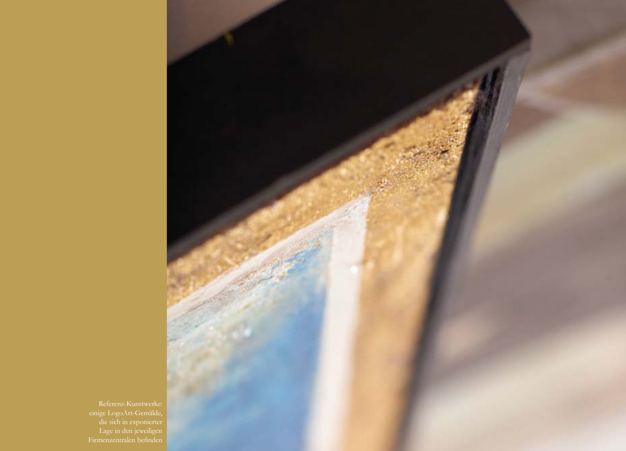
Referenz-Kunstwerke: einige LogoArt-Gemälde, die sich in exponierter Lage in den jeweiligen Firmenzentralen befinden

Ein Markenlogo kommuniziert Werte und repräsentiert das Unternehmen