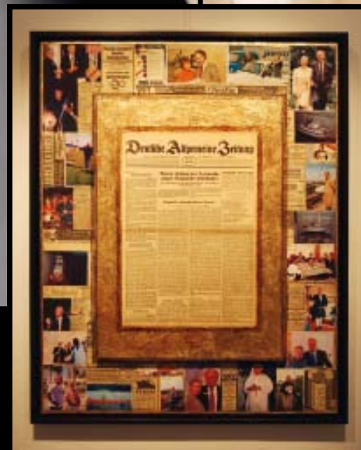
ZeitArt-Beispiel: Die Originalzeitung im Mittelpunkt, persönliche Fotos sowie Werbeslogans aus der gleichen Zeitung eingearbeitet