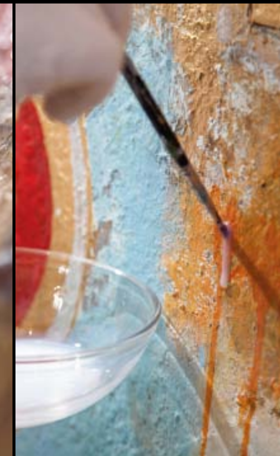
Detailarbeiten mit Blattgold und Leinöl